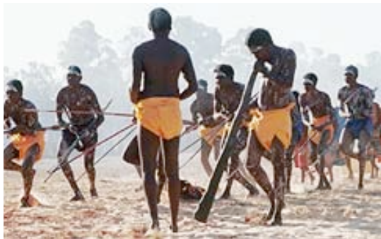
Terre du nord-est d'Arnhem

Les Yolngu, peuple indigène de la terre du nord-est d'Arnhem, ont combattu fermement toutes les tentatives pour les priver de leurs terres ancestrales. Aujourd'hui cette péninsule au Nord de l'Australie est une exception, elle appartient et toujours est en grande partie contrôlée par ses propriétaires traditionnels.